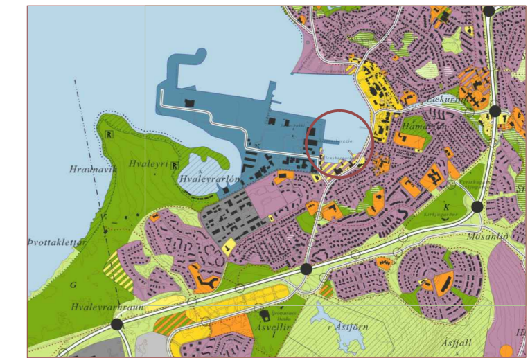
STAÐSETNING Í BÆJARLANDINU